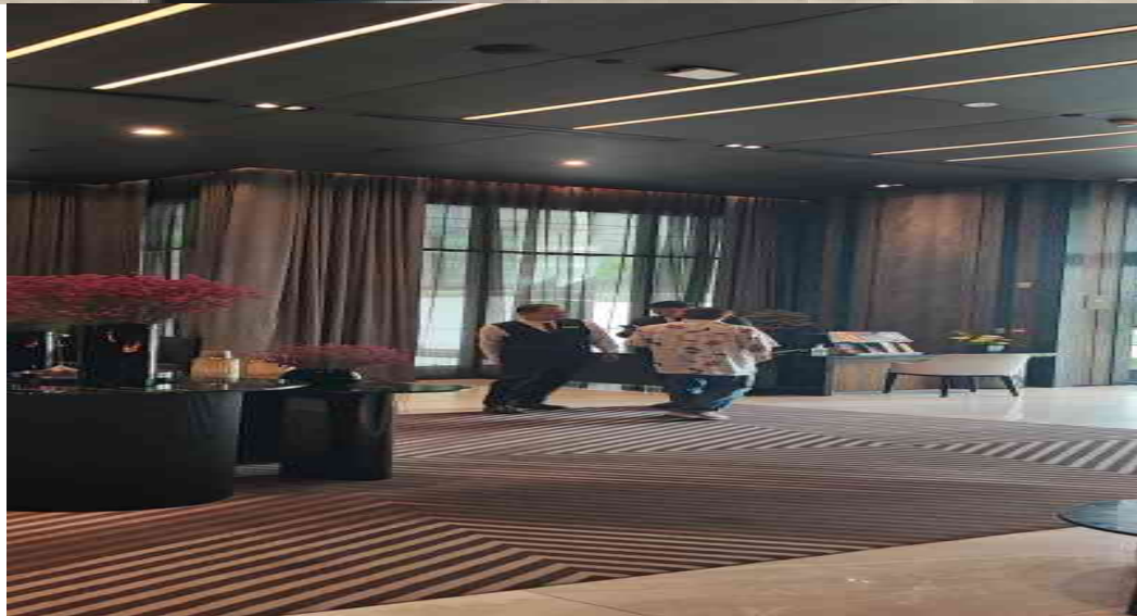
รูปที่ 7 พนักงานต้อนรับภายในบริเวณพื้นที่โครงการ