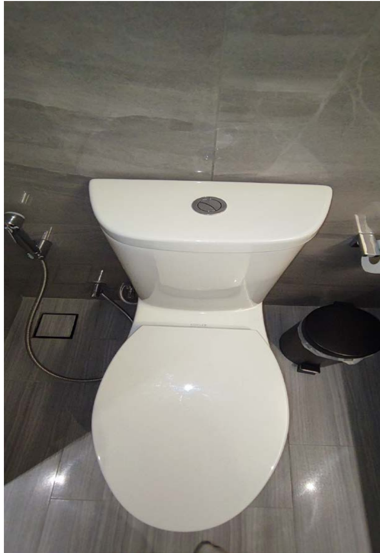
รูปที่ 5 แสดงสุขภัณฑ์ประหยัสน้ำของโครงการ