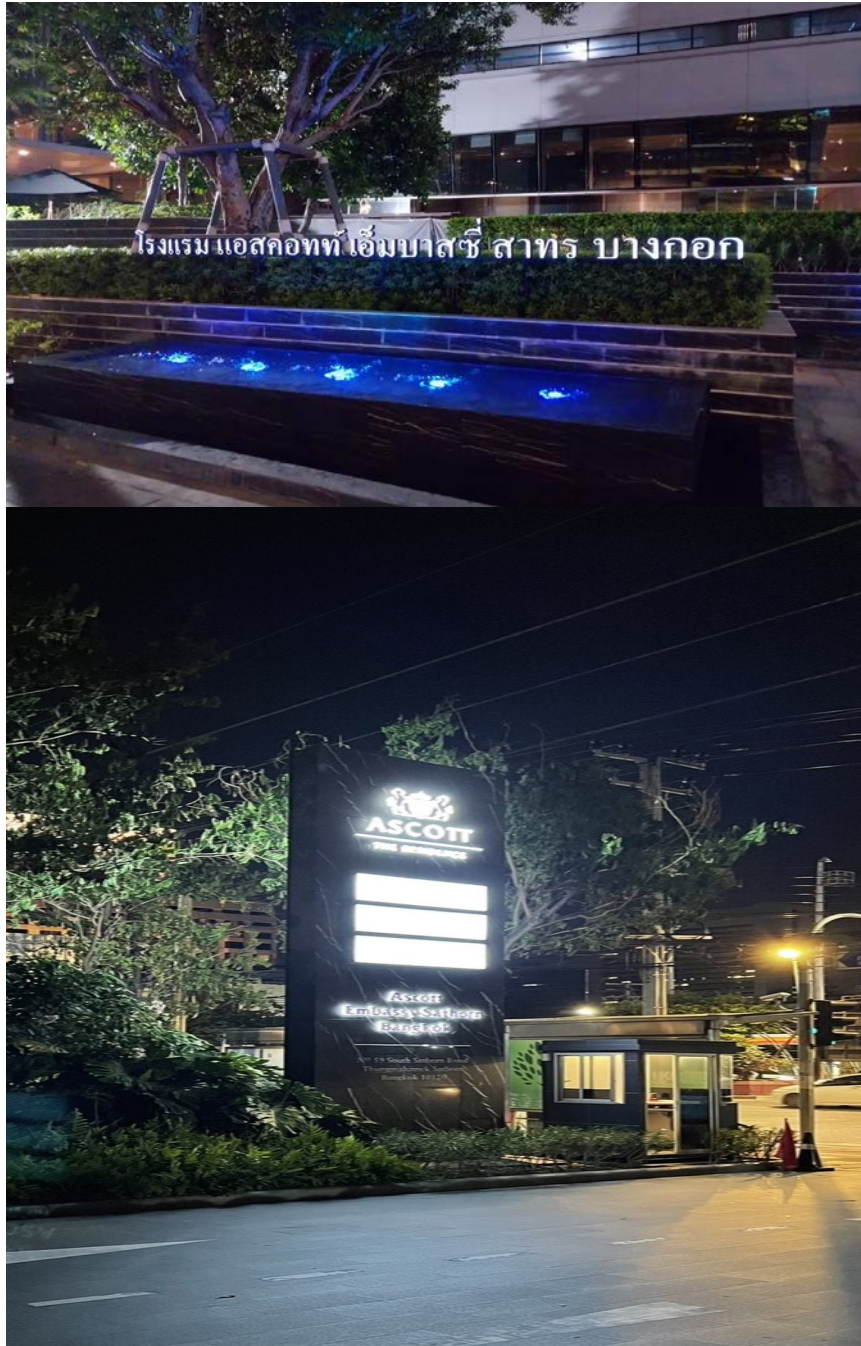
รูปที่ 12 แสดงแสงสว่าง-สวน-ป้ายโครงการ

โครงการ แอสคอตท์ เอ็มบาสซี สาทร์ ระยะดำเนินการ ช่วงเดือน มกราคม 2569 ถึง เดือน มิถุนายน 2569