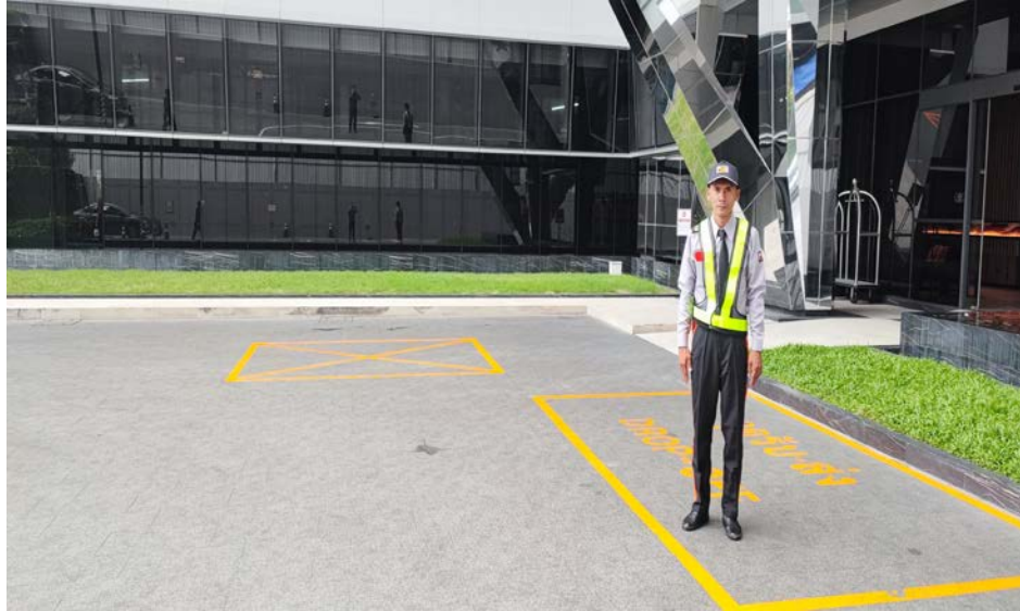
รูปที่ 3 แสดงเจ้าหน้าที่อำนวยความสะดวก ประจำพื้นที่บริเวณที่จอดรถ

โครงการ แอสคอต เอ็มบาสซี สาทร ระยะดำเนินการ ช่วงเดือน มกราคม 2569 ถึง เดือน มิถุนายน 2569