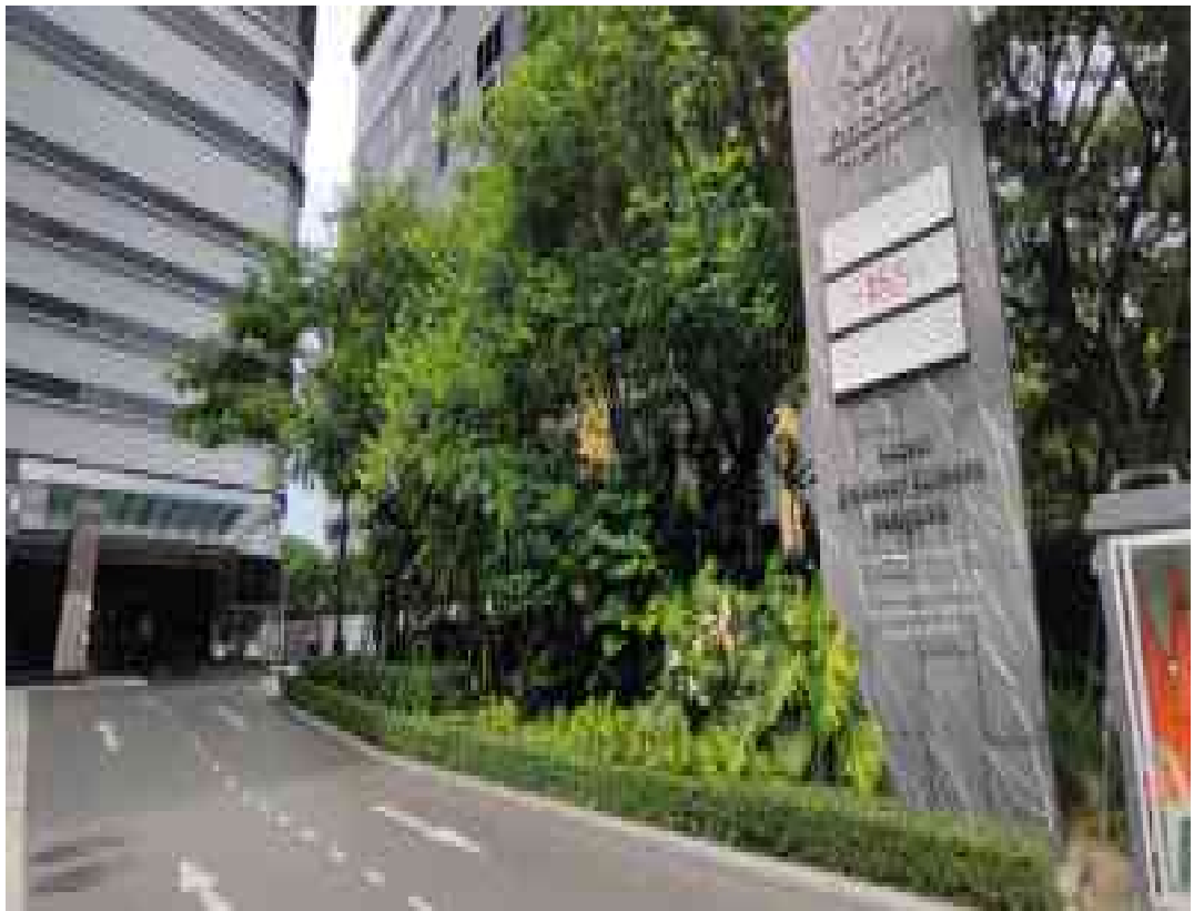
รูปที่ 2 แสดงทางเข้า-ออกโครงการ

โครงการ แอสคอตท์ เอ็มบาสซี สาทร ระยะดำเนินการ ช่วงเดือน มกราคม 2569 ถึง เดือน มิถุนายน 2569