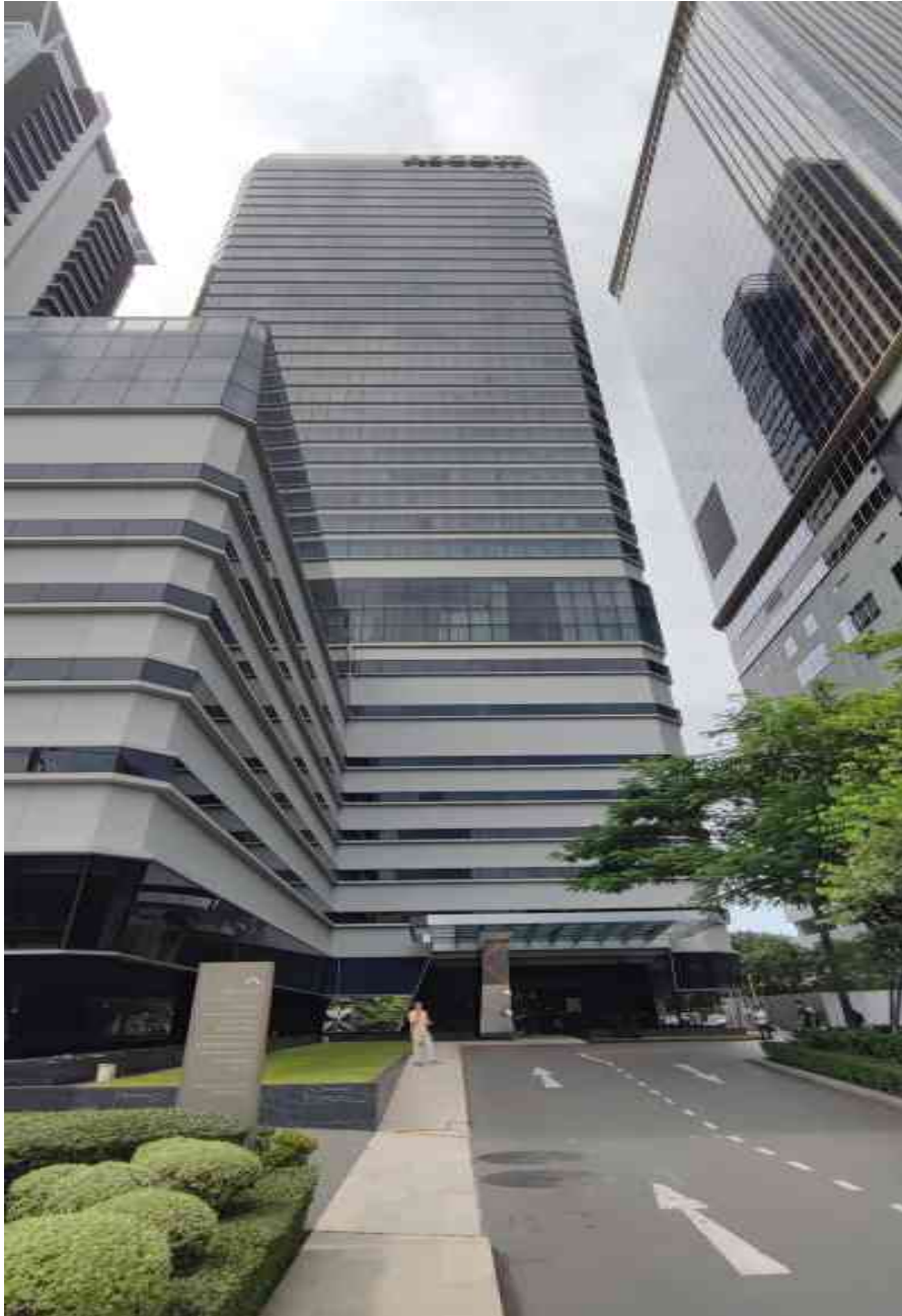
รูปที่ 1 แสดงอาคาร ณ ปัจจุบัน