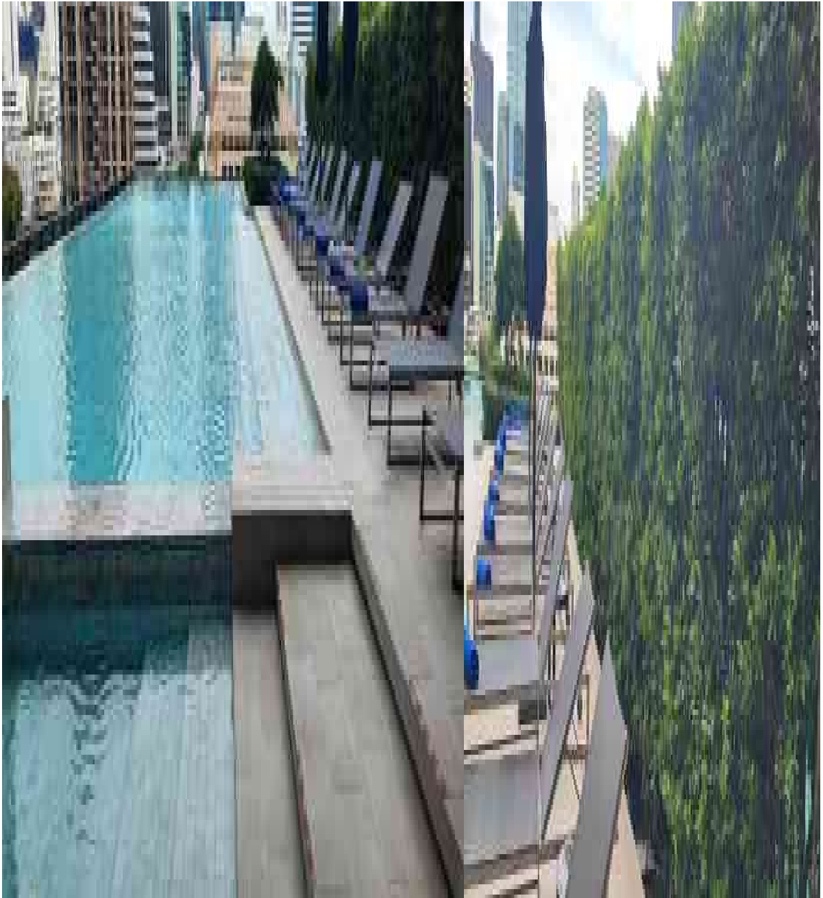
รูปที่ 10 แสดงต้นไม้ชั้นสระว่ายน้ำของโครงการ