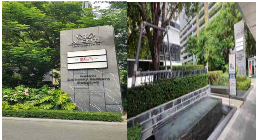
รูปที่ 4 แสดงป้ายชื่อโครงการชัดเจน