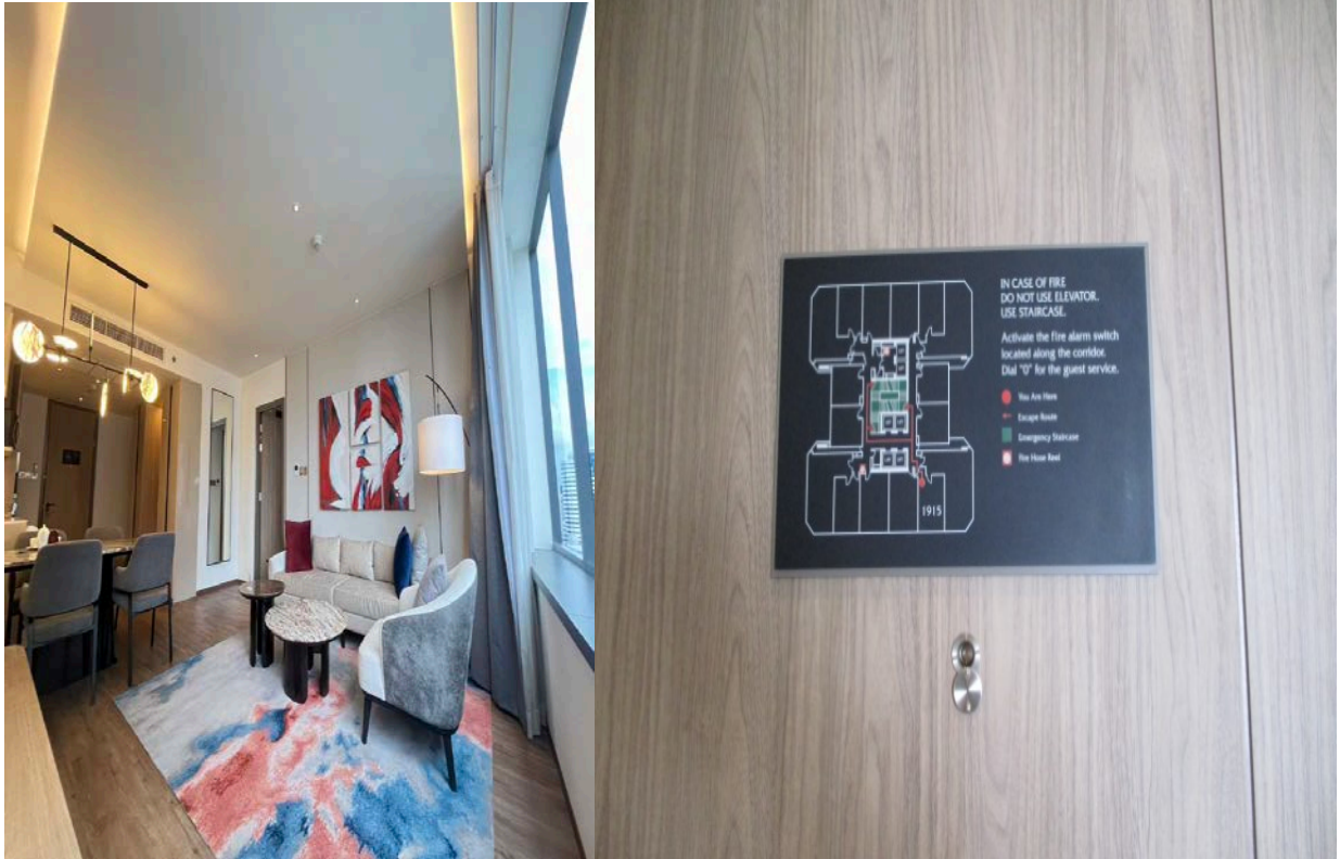
รูปที่ 8 แสดงห้องพักโครงการ และผังแสดงทางหนีไฟที่ประตูห้องของโครงการ