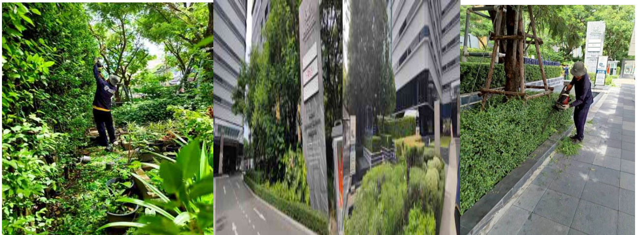
รูปที่ 9 แสดงต้นไม้ของโครงการ